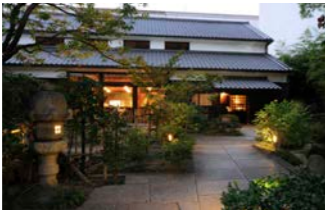
「蔵の料亭さかばやし」にてランチ

旅の始まりは神戸に寄港。旧居留地には、1880年頃に建てられた旧神戸居留地十五番館をはじめ、大正から昭和期にかけてのレトロなビルが立ち並んでいます。開港の歴史を温めた、異国情緒漂う町の散策をお楽しみください。昼食はノーベル賞晩餐会で振舞われた「福寿」の蔵元直営の日本料理店「蔵の料亭さかばやし」にてご用意しました。