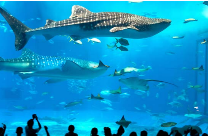
まるで海の中にいるような迫力！沖縄美ら海水族館を見学します

■最少催行人員：10名様 ■食事：朝食9回、昼食8回、夕食9回 ■添乗員：東京国際クルーズターミナルご出発時から東京国際クルーズターミナルご到着時まで同行いたします。 ■バスポート必要残存有効期間：下船時6か月以上 ■バスポート査証未使用欄：見開き2ページ以上必要 ■旅行代金にはクルーズ関連諸税51,000円は含まれておりません。 ■旅行代金には船内チップが含まれております。