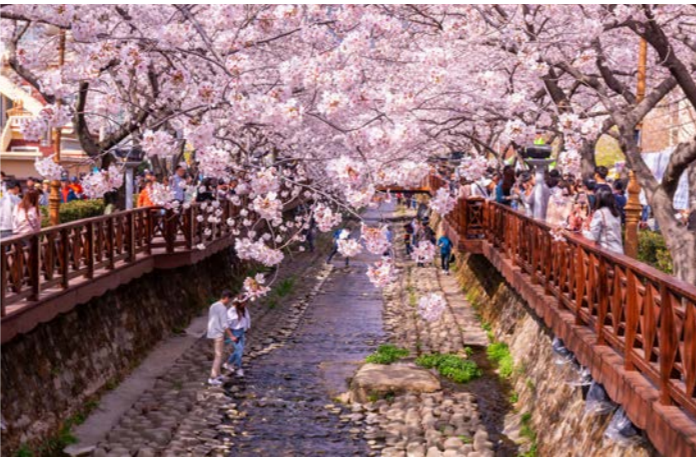
余佐川沿いの桜並木を散策します(韓国・鎮海 イメージ)

■最少催行人員：10名様 ■食事：朝食10回、昼食9回、夕食10回 ■添乗員：東京国際クルーズターミナルご出発時から東京国際クルーズターミナルご到着時まで同行いたします。 ■バスポート必要残存有効期間：下船時6か月以上 ■バスポート査証未使用欄：見開き2ページ以上必要 ■旅行代金にはクルーズ関連諸税56,000円は含まれておりません。 ■旅行代金には船内チップが含まれております。