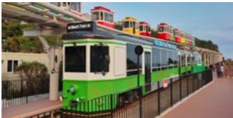
海雲台尾浦から松亭までの4.8キロの区間を走る海雲台海辺列車