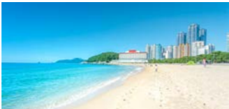
マリンプールの海が美しい海雲台は釜山を代表する観光地です