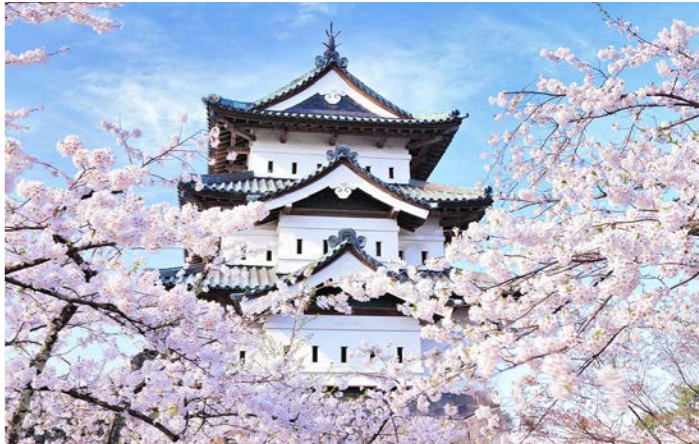
桜とのコラボレーションが美しい弘前城(イメージ)

■最少催行人員：10名様 ■食事：朝食9回、昼食8回、夕食9回 ■添乗員：東京国際クルーズターミナルご出発時から東京国際クルーズターミナルご到着時まで同行いたします。 ■バスポート必要残存有効期間：下船時6か月以上 ■バスポート査証未使用欄：見聞き2ページ以上必要 ■旅行代金にはクルーズ関連諸税53,000円は含まれておりません。 ■旅行代金には船内チップが含まれております。