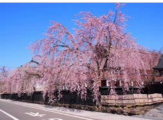
武家屋敷を彩る角館の枝垂桜

秋田ではみちのくの小京都・角館を訪ねます。玉川と松木内川に挟まれるようにして拓けた町は、火除(ひよけ)と呼ばれる広場を中心に、武家屋敷が立ち並び北側の「内町」、商人街として栄えた南側の「外町」に分かれています。武家屋敷を桜が彩る、春ならではの散策をお楽しみください。昼食は料亭稲穂で、庭園をご覧いただきながらお食事をご堪能ください。