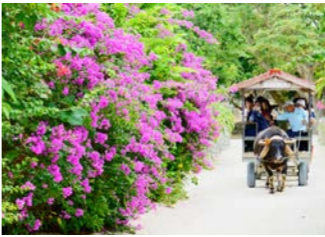
牛車がのんびりと進む、どこか懐かしい島の風景(イメージ)

まかれた道沿いに、石垣に囲まれた赤瓦の古集落が残された竹富島は、沖縄初の重要伝統的建造物群保存地区に選ばれています。赤瓦集落の散策のほか、コンディビーチや星砂の浜などの美しいビーチもご案内します。