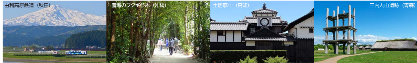
日本各地、様々な寄港地へ