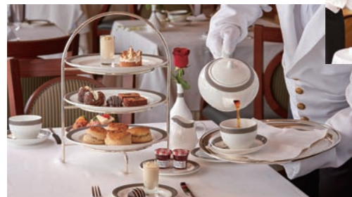
英国伝統の優雅なアフタヌーンティー

生演奏が流れる優雅な雰囲気の中で、ホワイトスター・サービスの資格を持つ白手袋を嵌めたスチュワードがサーブします。