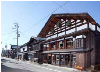
重伝建・増田の町並み

最初の寄港地・秋田ではローカル線「由利高原鉄道」に乗って、約40分間ののどかな鉄道旅へ。山頂に雪の残る鳥海山と早春の田園風景が、車窓に広がります。また重伝建に指定された増田も訪問。主屋と蔵が一体化した内蔵造りの家々が建ち並ぶ町の散策と、昼食をお楽しみください。