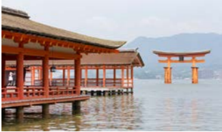
厳島神社(イメージ)

てられた寝殿造の御本社や、2022年12月に改修工事が完了した大鳥居の新たな姿も間近にご覧いただけます。