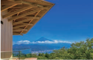
標高約300メートルの丘陵地に建つ日本平夢テラス

釜山屈指のリゾートである海雲台は、約2キロにわたって白砂のビーチが広がる海沿いの地区。ここでは海雲台海辺列車に乗り、鉄道旅に出かけましょう。旧東海南部線の鉄道施設を再開発し、2020年に誕生した観光列車で、車窓からは高層ビルの並ぶ釜山の町と美しい海の絶景をご覧ください。