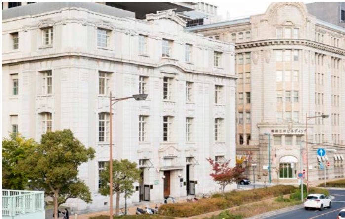
旧居留地のおしゃれな町並みはまるでヨーロッパのよう

■最少催行人員：10名様 ■食事：朝食10回、昼食9回、夕食10回 ■添乗員：東京国際クルーズターミナルご出発時から東京国際クルーズターミナルご到着時まで同行いたします。 ■バスポート必要残存有効期間：下船時6か月以上 ■バスポート査証未使用欄：見聞き2ページ以上必要 ■旅行代金にはクルーズ関連諸税56,000円は含まれておりません。 ■旅行代金には船内チップが含まれております。