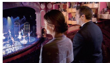
レベルの高いミュージカルもご覧いただけます

英国ミュージカルの最高峰ウェストエンドの名作や、マジックショー、寄港地に因んだゲストミュージシャンの特別コンサートなどお楽しみいただけます。