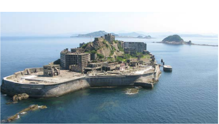
軍艦島は1974年に閉山後、ツアーでのみご案内できる産業文化遺産です

■最少催行人員：10名様 ■食事：朝食10回、昼食9回、夕食10回 ■添乗員：東京国際クルーズターミナルご出発時から東京国際クルーズターミナルご到着時まで同行いたします。 ■パスポート 必要残存有効期間：下船時6か月以上 ■パスポート 査証未使用欄：見開き2ページ以上必要 ■旅行代金にはクルーズ関連諸税56,000円は含まれておりません。 ■旅行代金には船内チップが含まれております。