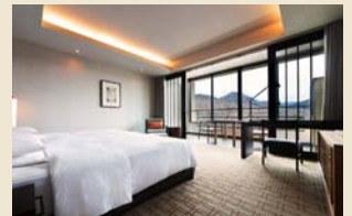
広々とした客室でお過ごしいただけます

「箱根の我が家」をコンセプトに上質で温かみのある滞在をお楽しみいただけます。客室は56㎡以上と広々です。