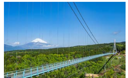
三島スカイウォークから富士の絶景を楽しみます

ツアープランお申し込みは右記まで ※ご予約の電話は混み合っつながらりにくい場合がございます。 名古屋支店 TEL : 052-252-2110